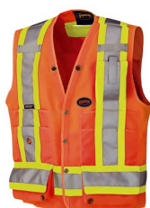
Vestes de circulation - Veste de sécurité d'arpenteur haute visibilité Pioneer