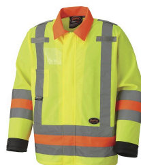
Manteaux et vestes - Veste de travail respirante à haute visibilité pour le contrôle du trafic Pioneer