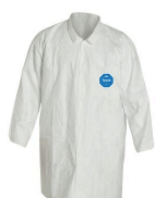
Sarraux - Sarrau à usage limité résistant aux particules DuPont™ Tyvek® 400