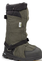
Couvre-chaussures - Couvre-chaussures isolées avec semelles extérieures Glacier Trek Neos Navigator 5