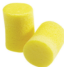
Bouchons d'oreilles - Bouchons d'oreilles en mousse 3M™ E-A-R™ 312-1201 Classic™ résistants à l'humidité