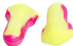
Bouchons d'oreilles - Bouchons d'oreilles sans corde à usage unique Honeywell Laser Lite®