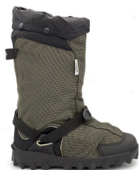
Couvre-chaussures - Couvre-chaussures 15" en nylon léger avec mousse de polyurethane Neos Navigator