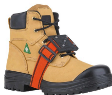
Crampons - Crampons à glace centrés à profil régulier Surewerx K1 Mid-Sole