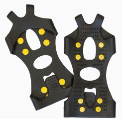
Crampons - Crampons antidérapants Kosto K-Grip