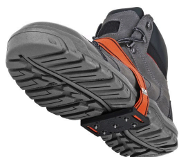
Crampons - Crampons à glace centrés à profil bas Surewerx K1 Mid-Sole