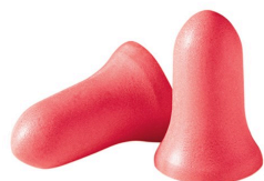
Bouchons d'oreilles - Bouchons d'oreilles sans fil à usage unique Honeywell Maximum MAX-1