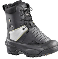
Work Boots with Metatarsal Protector - Bottes d'hiver avec protection métatarsienne Baffin Blastcap