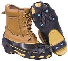
Cleats - Crampons tout usage pour l'hiver Surewerx Due North