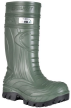
Waterproof Work Boots - Bottes de travail en PU isolées avec protection métatarsienne interne Cofra Thermic