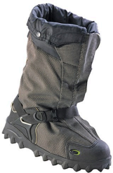
Overshoes - Couvre-chaussures 15" en nylon léger avec mousse de polyurethane Neos Navigator