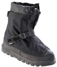
Overshoes - Couvre-chaussures de travail toutes saisons en nylon léger Neos Voyager