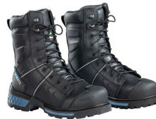
Lined Work Boots - Bottes de travail d'hiver avec semelle anti-dérapante Ice Monster Baffin