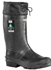
Lined Work Boots - Bottes de travail Refinery avec embout d'acier pour hommes Baffin