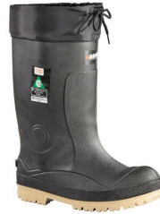
Lined Work Boots - Bottes unisexes imperméables doublées certifiées CSA Baffin Titan