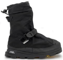
Overshoes - Couvre-bottes avec semelles extérieures Glacier Trek™ SPK Neos Voyager GT