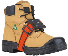
Cleats - Crampons à glace centrés à profil régulier Surewerx K1 Mid-Sole