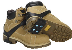
Cleats - Talonnière antidérapante Due North Surewerx