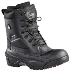
Lined Work Boots - Bottes de travail doublées résistantes à l'huile et aux acides Baffin Workhorse