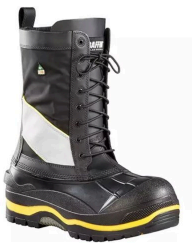
Lined Work Boots - Bottes d'hiver certifié CSA Baffin Constructor