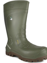
Waterproof Work Boots - Bottes de travail d'hiver avec protection métatarsienne Acton Bering