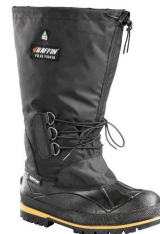
Lined Work Boots - Bottes de travail 14" doublées Baffin Driller