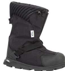
Overshoes - Couvre-chaussures de travail isolées de 11" avec semelles extérieures Glacier Trek™ SPK Neos Explorer