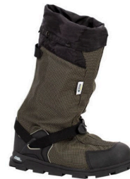
Overshoes - Couvre-chaussures de travail isolées de 15" avec semelles extérieures Glacier Trek™ SPK Neos Navigator 5™