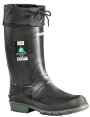
Lined Work Boots - Bottes de travail en caoutchouc imperméables toute saison Baffin Hunter