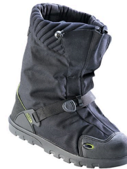
Overshoes - Couvre-chaussures isolés en polyurethane avec nylon léger Neos Explorer