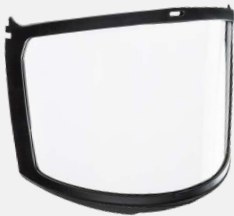
HP1491PF Écran facial de remplacement en PC/ABS