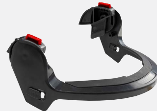
HP1491B Support de protection faciale