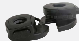
HP1491PC Connecteur pour écran des yeux