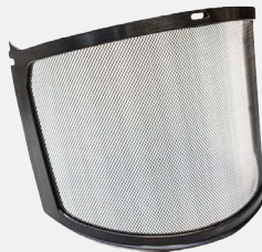
HP1491MF Écran facial de remplacement en maille métallique