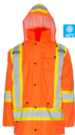
VMK775 Manteau 5 en 1